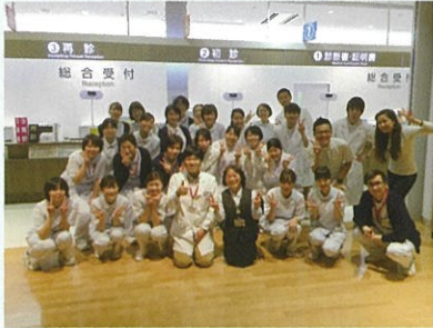
※DVD（動画）はホームページでご覧いただけます。